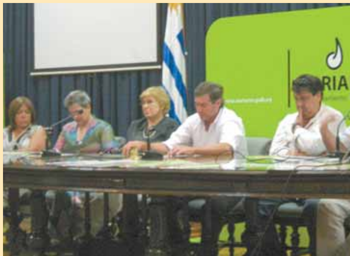
/ Canto Murga.

El jurado que actuara en el desfile concurso de llamadas, estará constituido por integrantes de la unidad temática por los derechos de los afrodescendientes, de la Intendencia de Montevideo.