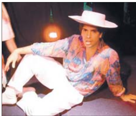
Semeneo Bailon, personaje de "La pandilla del bosque", la primer obra para niños que escribí el 99 en estrenada en arteatro