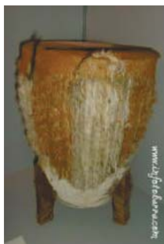
Tambor de Costa de Marfil

Tambor realizado sobre tronco de madera, forrado con piel de mamífero curtida, piel natural de mamífero emparchada en el tronco mediante incrustaciones de madera. Asas para transporte y trípode de madera en la base para su apoyo.(1)