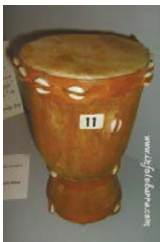
Tambor del Poblado de Akamba (Kenia)

Este fragmento del poema del Mío Cid, del siglo XII, es la primera mención al tambor en castellano antiguo.