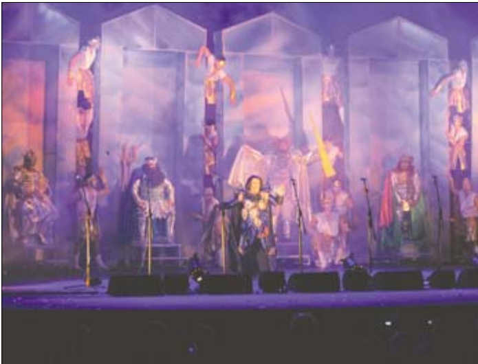
Momosapiens, 1 premio 2012.

Es también algo muy presente que las conexiones entre parodismo de Carnaval Mayor se emparente con parodismo de Carnaval de las Promesas, donde componentes de ambas fiestas, se comunican con fluidez, estableciendo una renovación en el elenco que da sus frutos. Sin embargo los cambios provienen de: