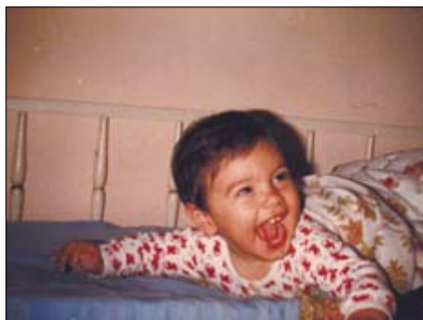
yo de 3 añitos riendo... dicen mis viejos que esa era la manera de despertarme